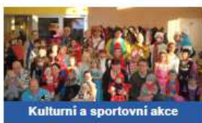
Kulturní a sportovní akce

Přihlášením k odběru hlášení dává registrovaný občan souhlas se zpracováním poskytnutých osobních údajů za účelem zaslání aktuálních informací z obce. Více informací o rozsahu a účelu zpracování a odvolání souhlasu najdete na adrese www.odrepsy.hlasenirozhlasu.cz nebo osobně na obecním úřadě.