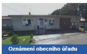
Oznámení obecního úřadu